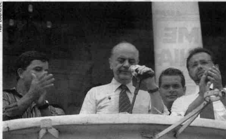
Serra garante a construção da primeira fase do VLT em Santos e São Vicente

que precisava de alguma adaptação para voltar a abrigar salas de aulas”, declarou. Os técnicos do Centro Paulo Souza (mantenedora das escolas técnicas do Estado) já haviam aprovado o local.