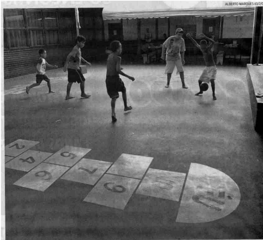
Abertura das escolas estaduais nos fins de semana garante aos alunos e à comunidade várias opções de lazer