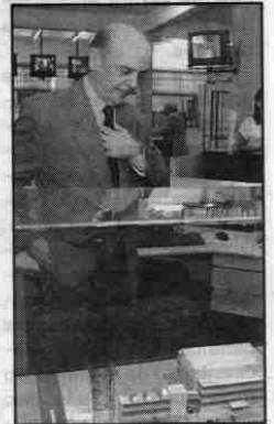
Serra viu a maquete e elogiou a conclusão. A TV Tribuna começará a exibir programas em sinal digital em dezembro, cinco anos antes do prazo dado pelo Ministério das Comunicações para tanto.