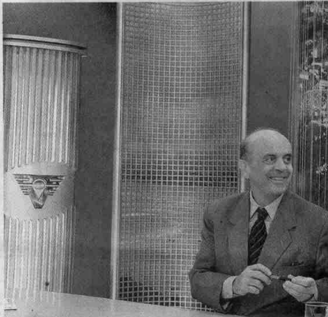
Governador José Serra participou do 'Jornal da Tribuna - 1ª edição'

O CDP santista deverá receber presos em situação provisória. Em março, também se prevê a abertura de um anexo ao CDP de São Vicente, com 496 vagas, e um CDP em Caraguatatuba, no Litoral Norte, com 768. (RM)