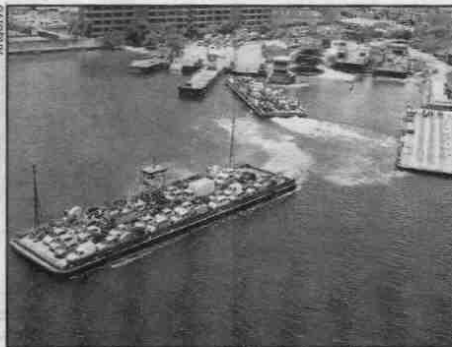
Ligação entre Santos e Guarujá deixaria de ser feita por balsas