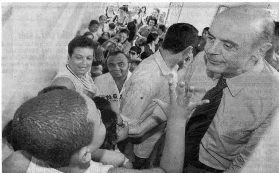
José Serra confirmou que o Grupão, em São Vicente, abrigará uma escola técnica já no segundo semestre

meio de transporte que preenche as necessidades, mas está muito aquém do que pode ser feito". A-4